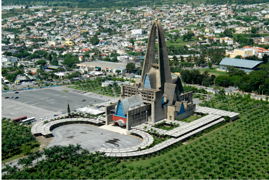
Sagrada Basílica de Higüey de Nuestra Señora La Virgen de La Altagracia