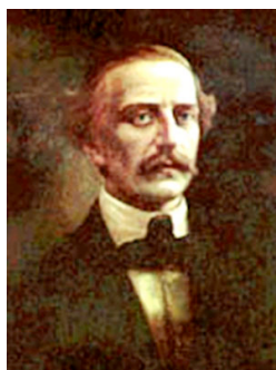
JUAN PABLO DUARTE Y DIEZ