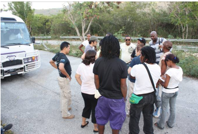
Explicación sobre el Polo Magnético, Polo