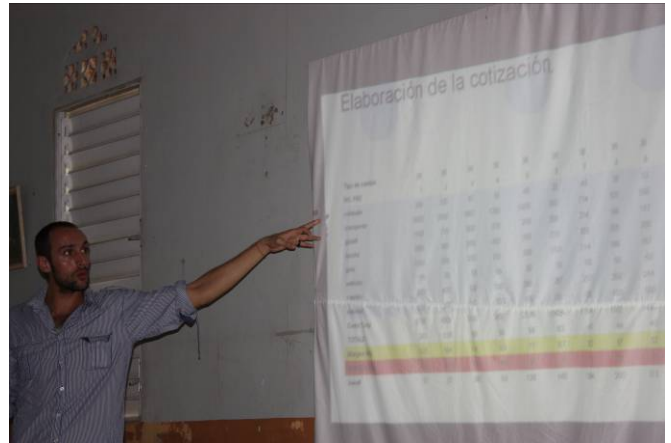
Cómo elaborar cotizaciones para las excursiones, Paraíso