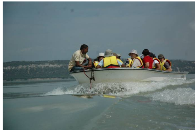
Excursión al Refugio de Vida Silvestre Laguna Cabral