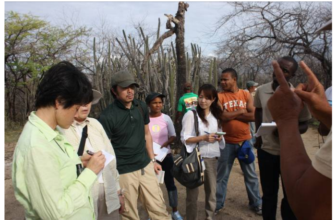
Visita a la Isla Cabritos, Parque Nacional Lago Enriquillo