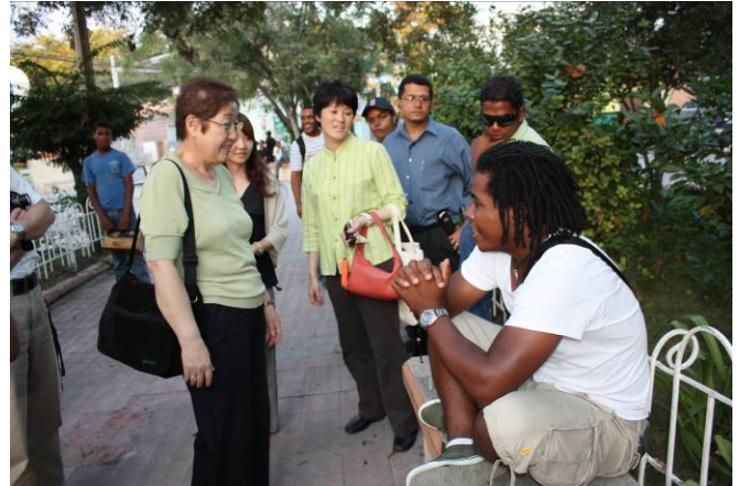
Caminata por la ciudad de Neyba