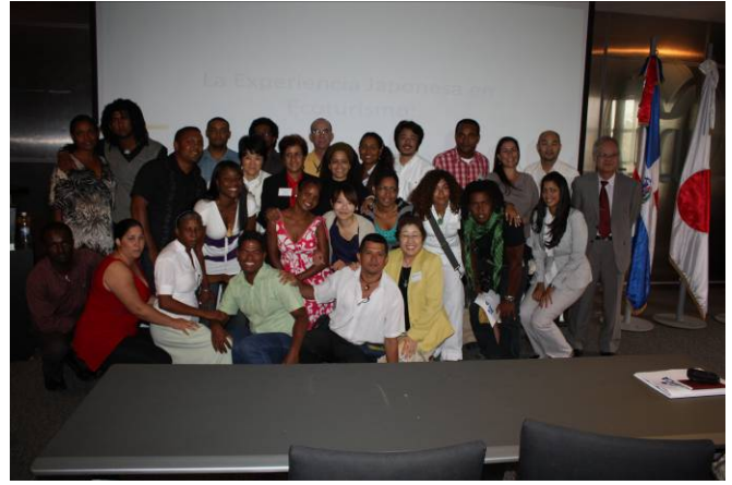
Foto de grupo de los ex participantes de turismo sostenible