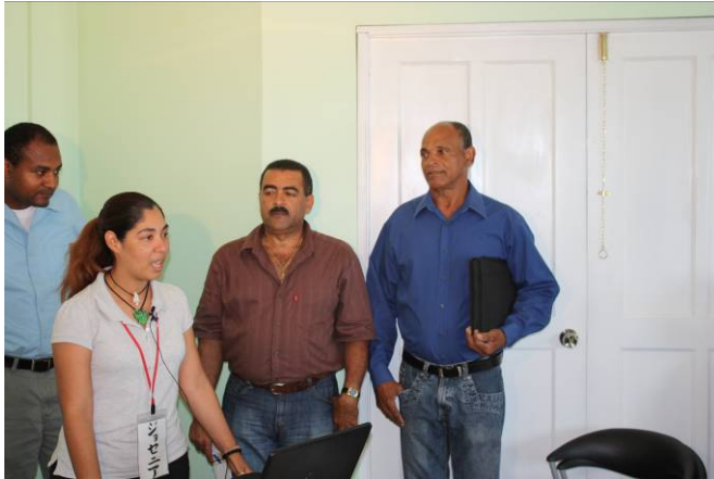
Bienvenida en el local de Araucaria, Barahona