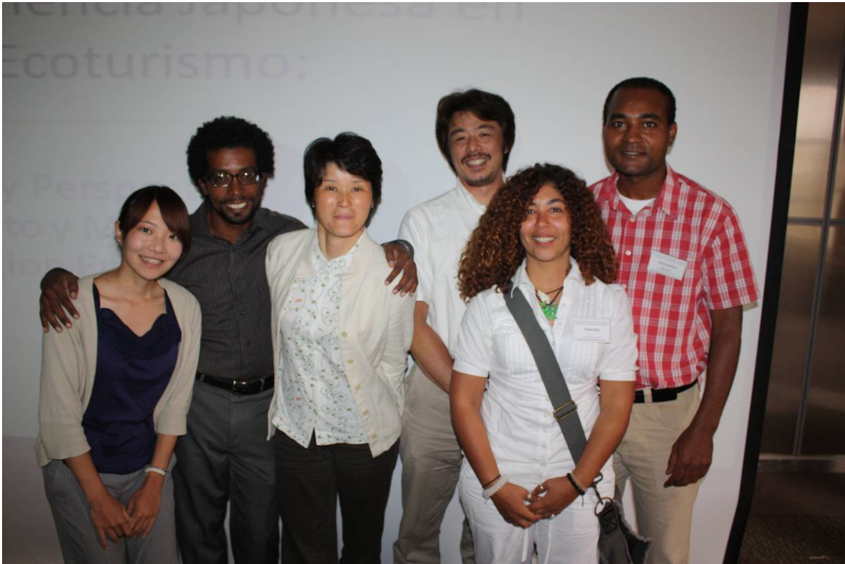
El equipo conductor del proyecto