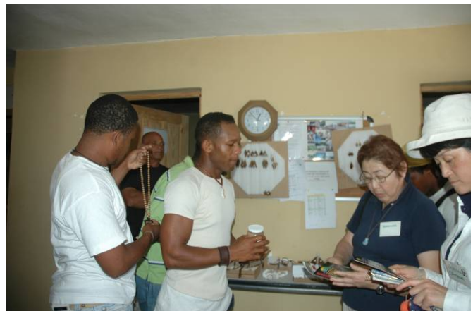
Visita a la Cooperativa de Mujeres de La Ciénaga