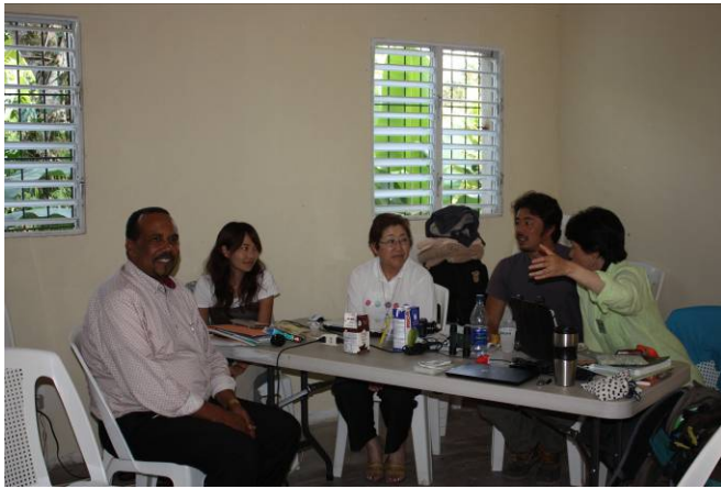
El Síndico de Polo en la presentación de los planes