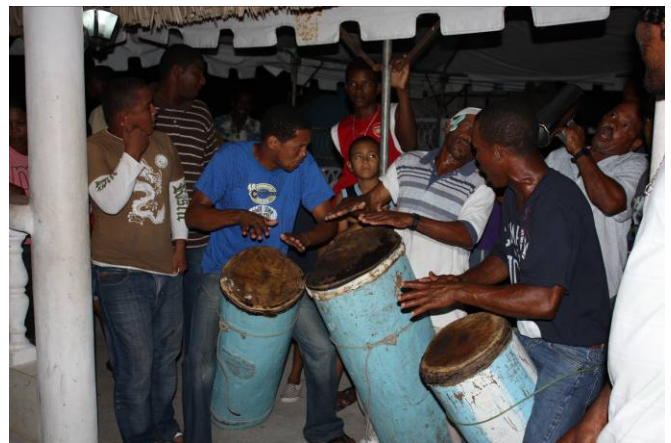
Actividad cultural en Duvergé "Toque de palos"