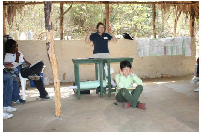
Conferencia en Puerto Escondido: ¿Qué es el Ecoturismo?