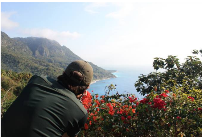
El Mirador del Paraíso