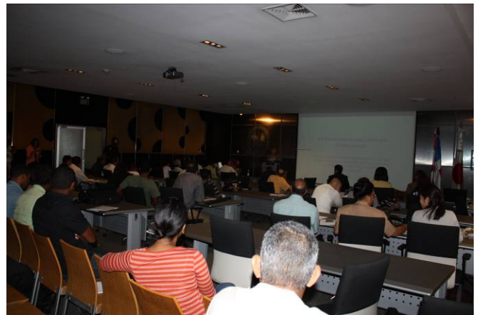
Asistentes a la Conferencia Magistral en la UASD