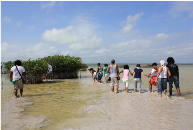
Excursión a Laguna de Oviedo