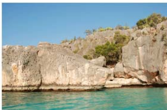
Vista de una de las zonas de Bahía de las Águilas, en Pedernales.