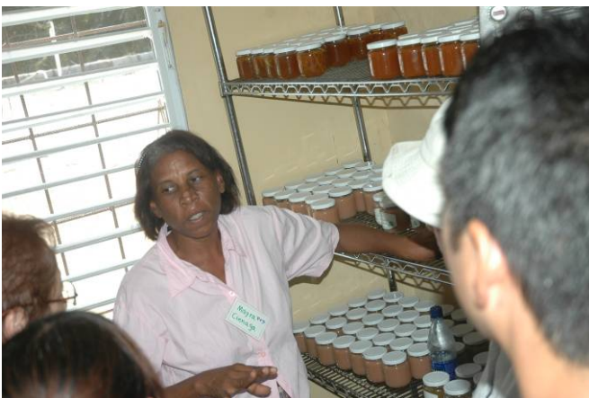
Mermeladas artesanales. Cooperativa de La Ciénaga