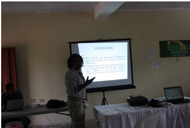
Presentación final de los planes de acción, Polo