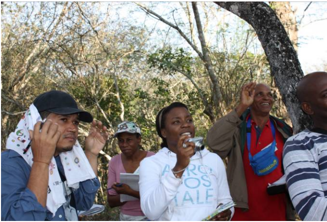
Observación de Aves en Rabo de Gato, Puerto Escondido