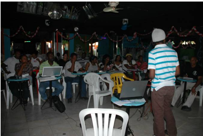
Cómo elaborar un plan de acción en 10 pasos, La Ciénaga