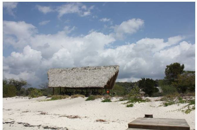
Excursión a Bahía de las Águilas