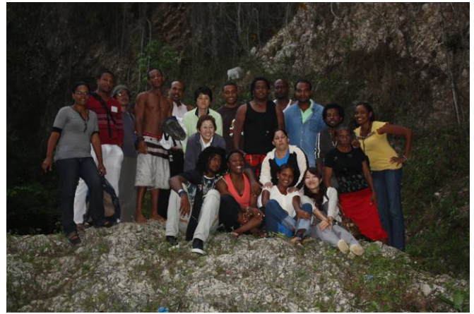
Visita al Balneario de Mata de Maíz, Polo