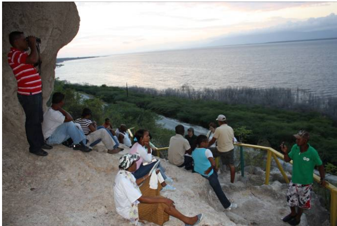
Visita al sitio antropológico de Las Caritas, La Descubierta