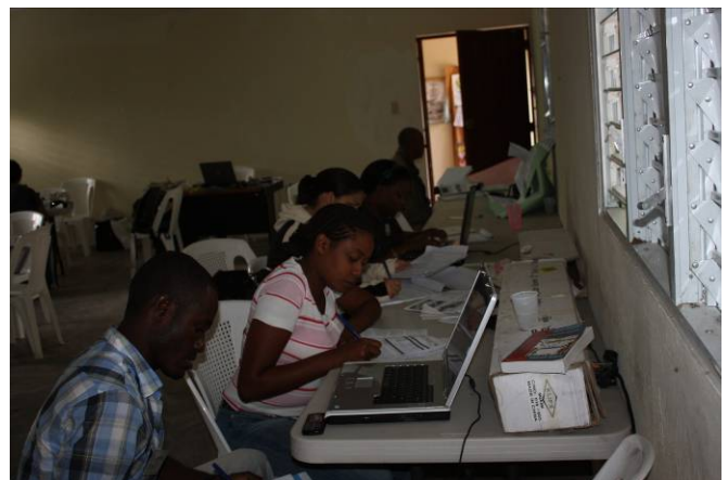
Presentación de Plan de Acción en Polo